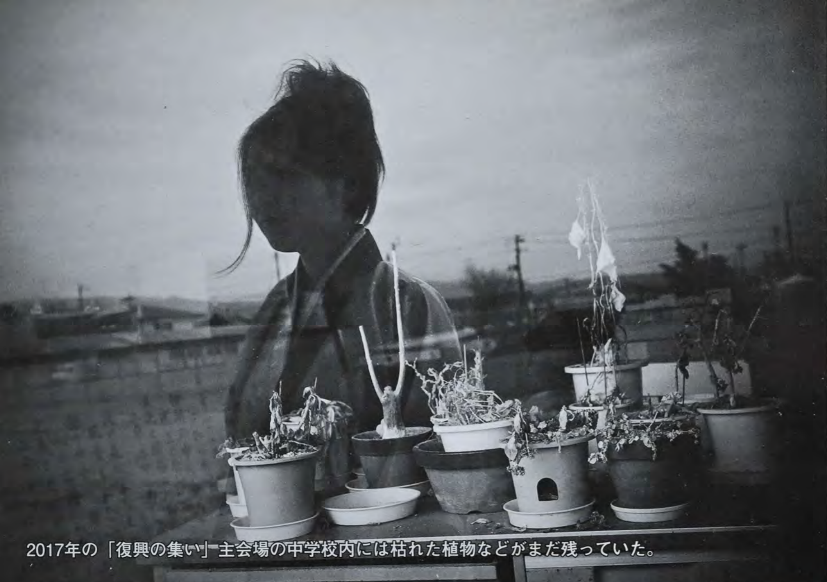
2017年の「復興の集い」主会場の中学校内には枯れた植物などがまだ残っていた。