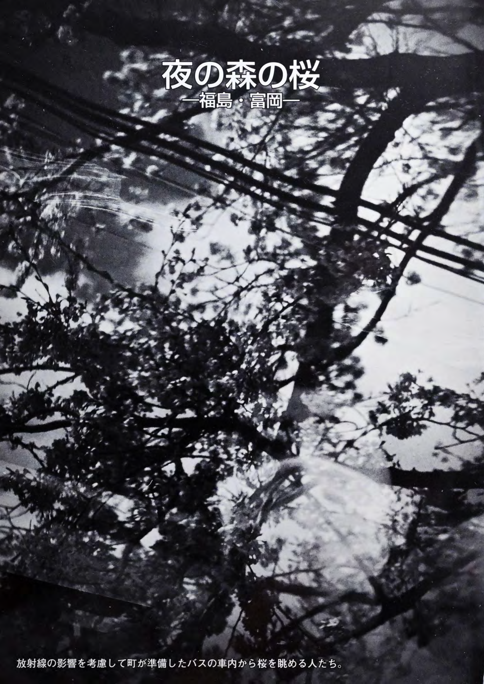
放射線の影響を考慮して町が準備したバスの車内から桜を眺める人たち。