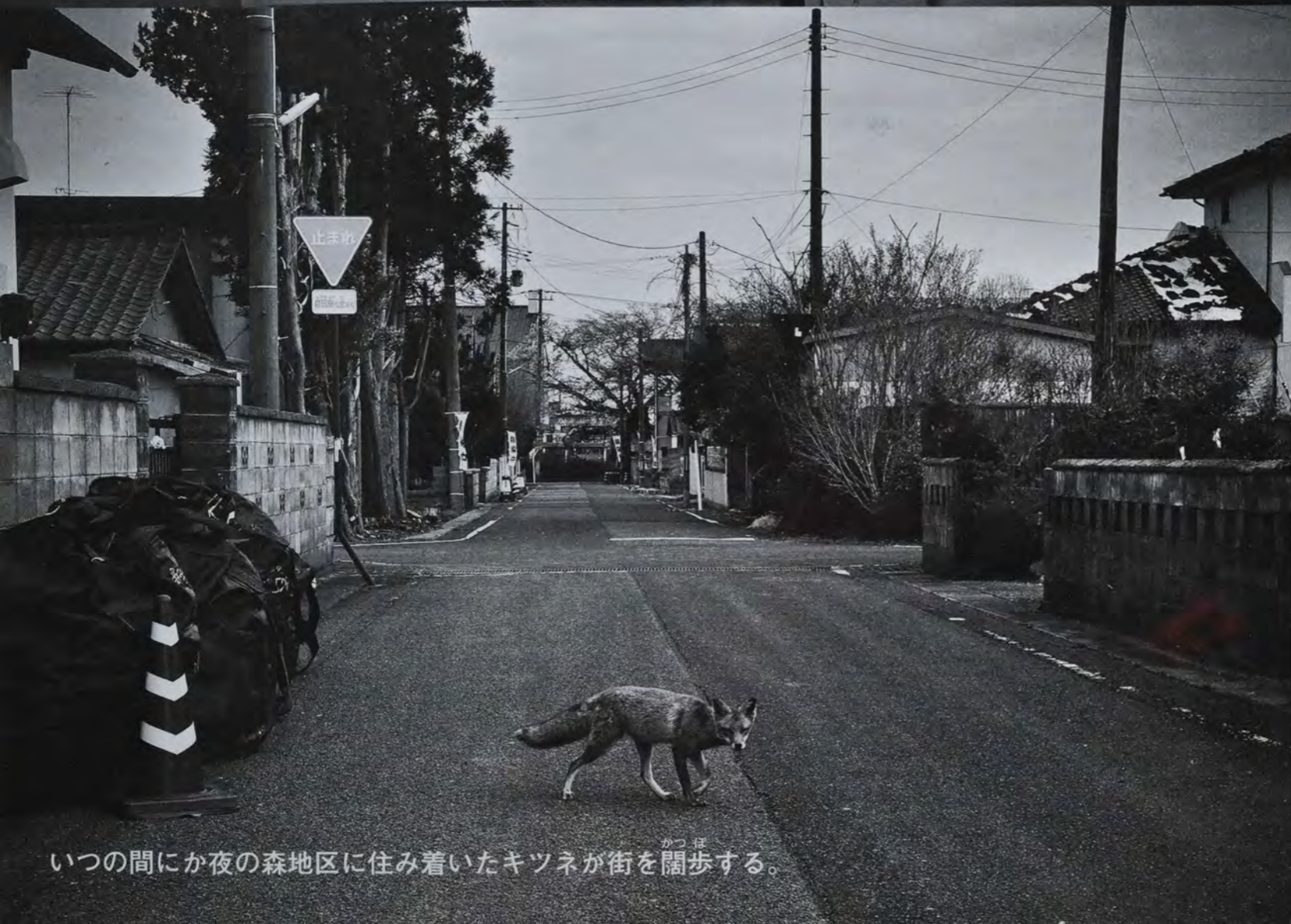
いつの間にか夜の森地区に住み着いたキツネが街を闊歩する。