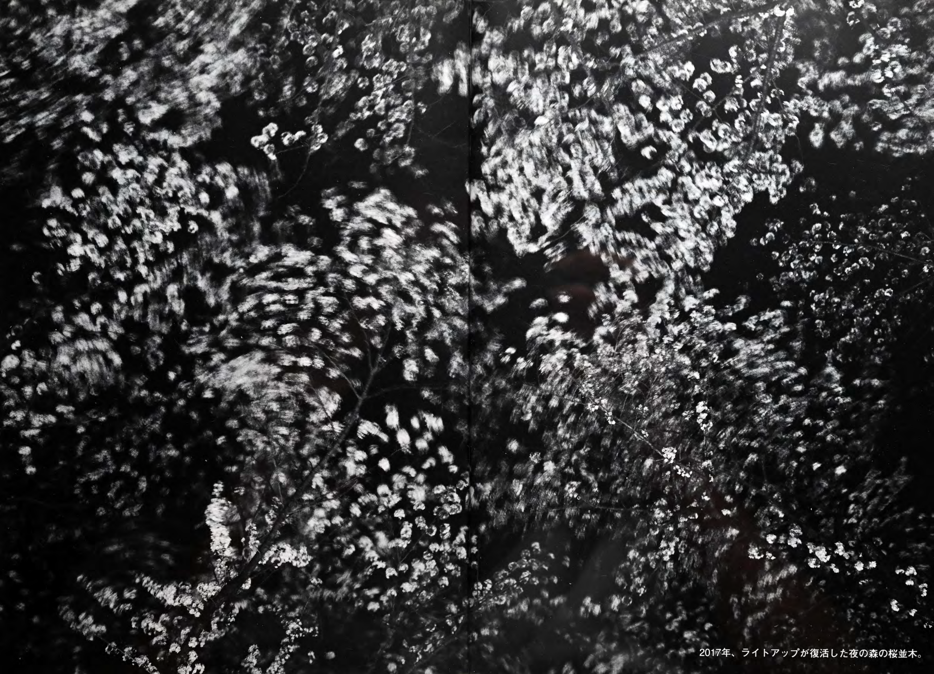
2017年、ライトアップが復活した夜の森の桜並木。